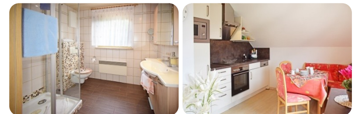
Küche mit Essgruppe